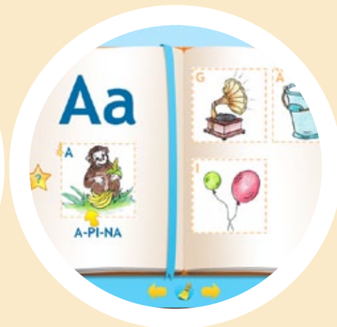
Игра «Всёлый алфавит»