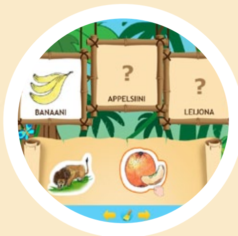
Игра «Знакомимся с джунглями»