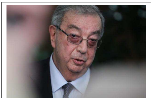
Евгений Примаков, бывший министр иностранных дел России

Объявлены окончательные результаты выборов нового президента России. С большим отрывом победил Владимир Путин.