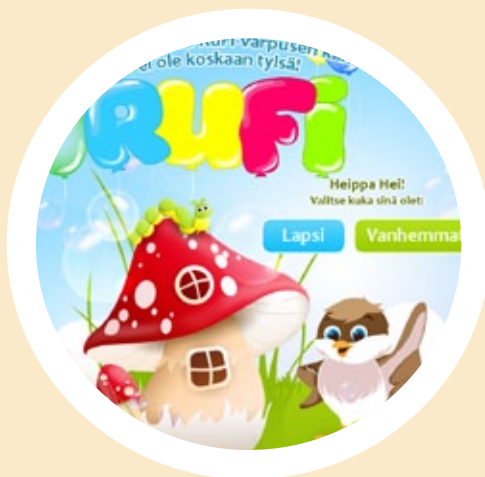
RuFi sivuston aloitus sivu

RuFi sivusto: www.mosaiikki.info/rufi/fi Katso kaikki pelit: www.mosaiikki.info/rufi/fi/lapsille/pelit